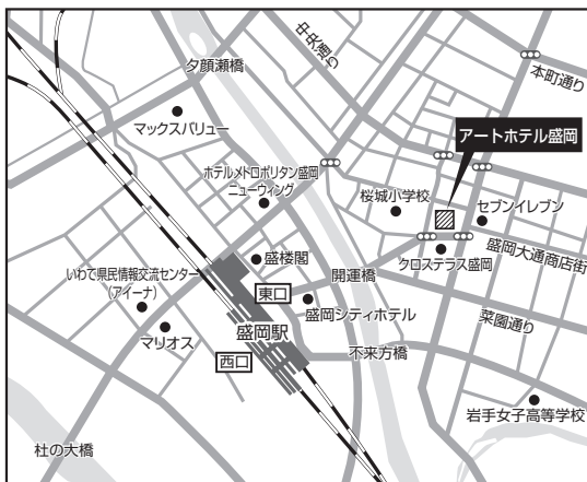
■盛岡会場：アートホテル盛岡