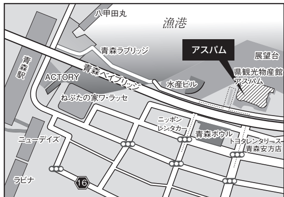
■青森会場：青森県観光物産館アスパム

【アクセス】○JR仙台駅西口 徒歩2分 ○JR仙石線「あおば通」 徒歩5分 ○地下鉄南北線「広瀬通」 徒歩5分