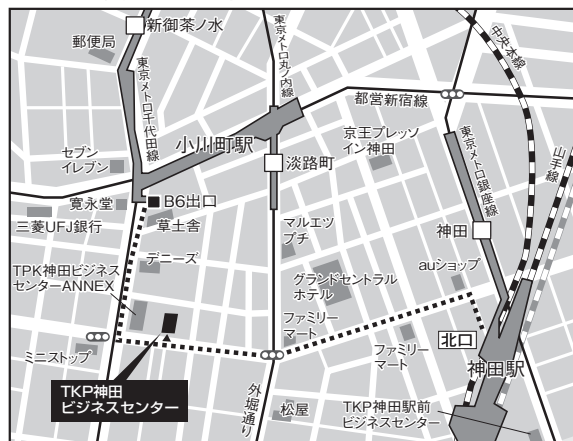
■東京会場：TKP神田ビジネスセンター

【アクセス】○JR山手線 神田駅 北口 徒歩5分 ○都営新宿線 小川町駅 出口B6 徒歩3分