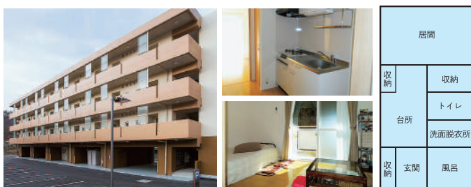
※あくまでも一例であり、病院により異なります。

ほとんどの県立病院に、単身赴任者用、独身者用の職員公舎を整備しています。公舎料はほとんどが4,000～8,000円程度です。金額は公舎の間取りや築年数により異なります。