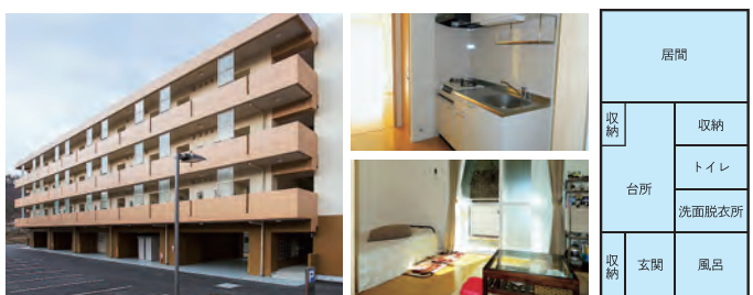
※あくまでも一例であり、病院により異なります。

ほとんどの県立病院に、単身赴任者用、独身者用の職員公舎を整備しています。公舎料はほとんどが4,000～8,000円程度です。金額は公舎の間取りや築年数により異なります。